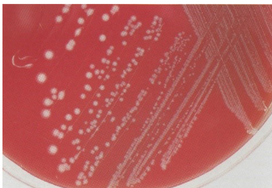
تصویر شماره ۲- باکتری پاستورلا مولتوسیدا

این باکتری در نواحی حلق، مجاری تنفسی و دستگاه گوارش کلونیزه می‌شود و بیماری پاستورلوزیس را ایجاد می‌کند که دوره کمون آن ۳-۵ روز می‌باشد و علائمی چون تب، بی‌حالی، افت تولید شیر، ترشحات موکوسی-چرکی از بینی و دهان، گاستروانتریت هموراژیک و انسفالیت هموراژیک از عوارض پیشرفته بیماری است که منجر به مرگ حیوان می‌گردد (۵) در نوع فوق حاد بیماری مرگ سریع اتفاق می‌افتد و در فرم حاد تب شدید، بی‌حالی، ترشح بزاق، اسهال خونی و ادم زیر جلدی مشاهده می‌گردد (تصویر شماره ۳) و از یافته‌های کالبدگشایی می‌توان به خونریزی بافت‌ها، تورم روده و تجمع خونابه در شکم و قفسه سینه اشاره