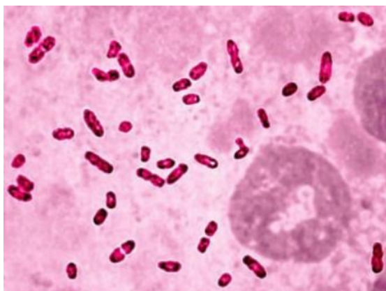
تصویر شماره ۱- باکتری پاستورلا مولتوسیدا

محیط کشت بلاد آگار کلونی‌های صاف و خاکستری دارد (تصویر شماره ۲). باکتری بی‌هوازی اختیاری است و کپسول دار می‌باشد که بر اساس آن به پنج گروه A, B, C, D, E, F تقسیم می‌شود (۴). مهم‌ترین سروتیپ آسیا و خاورمیانه B۲ بوده و سروتیپ E۲ بومی قاره آفریقا است.