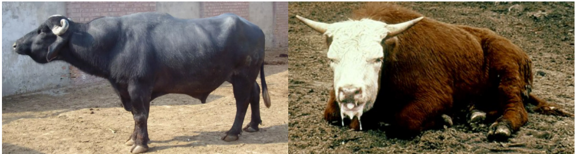
تصویر شماره ۳- ترشح بزاق و ادم زیرجلدی

نمود ضایعه مشخصه سپتی سمی هموراژیک، تورم زیر پوست و عضله ناحیه زیر فکی، گردن و سینه توسط مایع ادم شفاف تا خونی است. مایع سروزی به سروفبرینوس ممکن است در قفسه سینه، پریکارد و حفره شکم نیز وجود داشته باشد. ریه‌ها به‌طور قابل توجهی پر خون و ادماتوز هستند و کف معمولاً در حفره بینی، نای و برونش‌ها وجود دارد. از نظر میکروسکوپی، پنومونی بینابینی و ادم ریوی و همچنین ارتشاحات کانونی نوتروفیل‌ها و