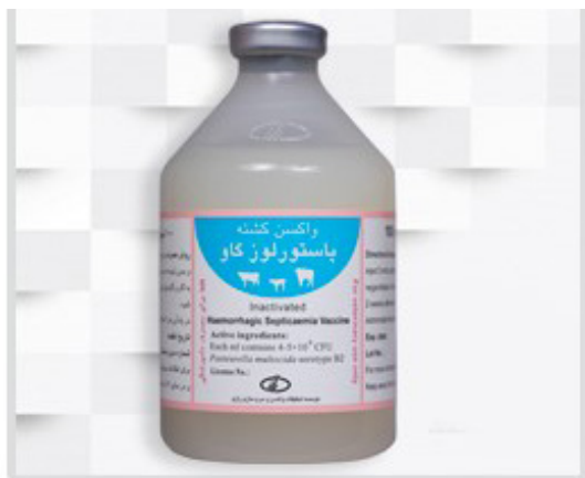
تصویر شماره ۵- واکسن پاستورلوز گاو تولید شده در موسسه رازی

واکسن پاستورلوز گاوی حاوی سروتیپ B۲ یکی از قدیمی ترین واکسن های تولیدی موسسه رازی می باشد (تصویر شماره ۵) که با استفاده از فرمالین غیر فعال می گردد و ادجوانت مورد استفاده در این واکسن سولفات آلومینیوم پتاسیم (آلوم) می باشد.